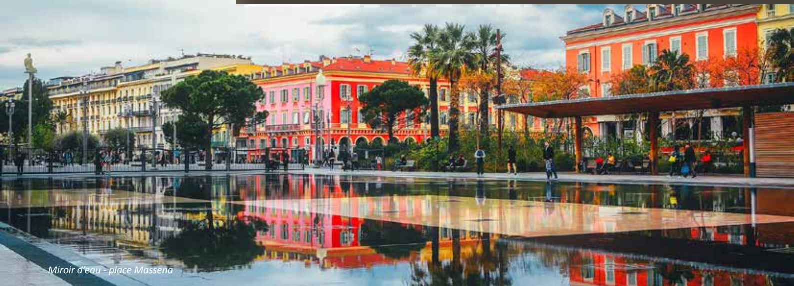
Miroir d'eau - place Massena