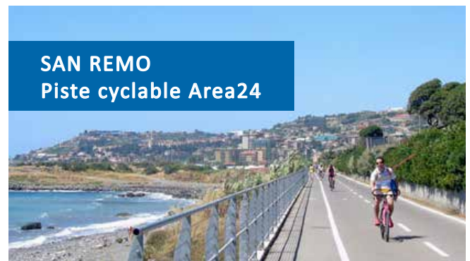
SAN REMO Piste cyclable Area24

En été, le parking de la plage est vite saturé. Préférez le train au départ de la gare Nice Riquier. La gare d'après (Villefranche) est juste au dessus de la plage.