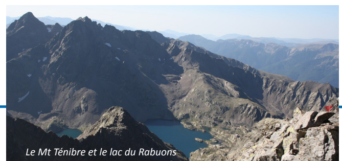
Le Mt Ténibre et le lac du Rabuons

Rando moyenne. Visite du bucolique plateau d'Anelle, ancien quartier "d'estive" comme en témoignent les nombreuses granges d'alpage bâties en bois de mélèze, localement appelées "butières", qui servaient à abriter le précieux fourrage en prévision des longs hivers.