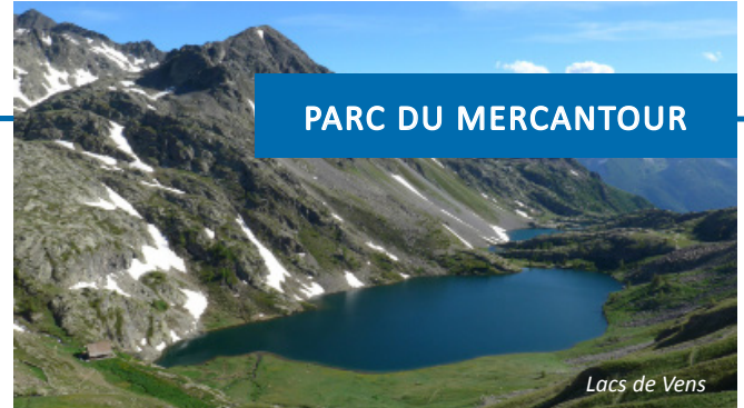
Lacs de Vens

Au cœur du parc du Mercantour, St Etienne est un point de départ exceptionnel pour de nombreuses randonnées. Avec un peu de chance vous pourrez observer chamois, bouquetins et marmottes. Les plus sportifs graviront le Mt Ténibre qui culmine à 3031 m