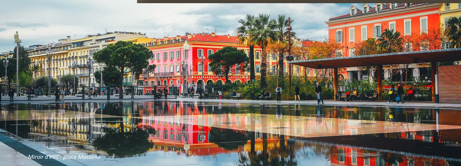
Miroir d'eau - place Massena